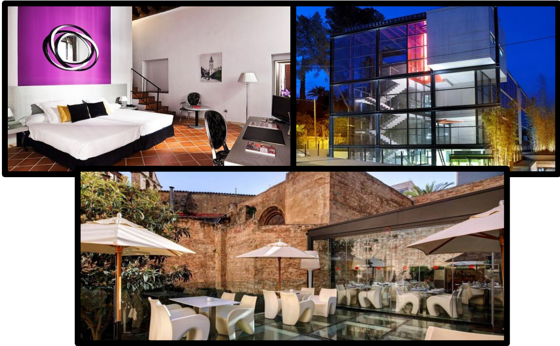
De arriba abajo, y de izquierda a derecha, Hotel Los Seises (Sevilla), Hotel Eurostars Angli y Hotel Olivia Plaza, ambos de Barcelona.