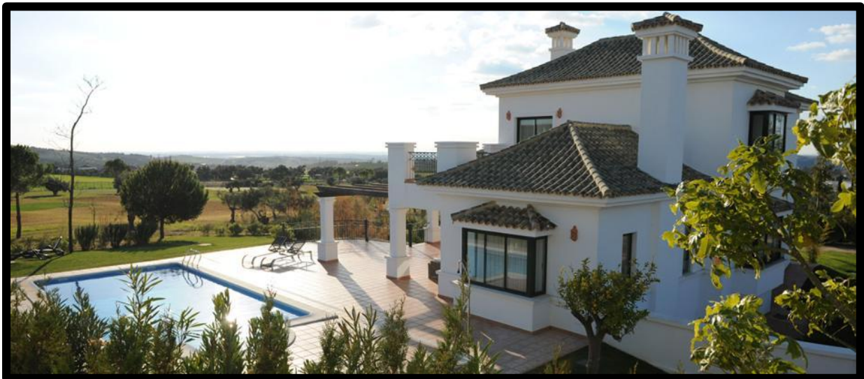
Hotel Arcos Gardens Golf Resort, en Arcos de la Frontera (Cádiz)

Además, si reservamos los packs de 24, 36 o 48 horas, nos permite disfrutar de escapadas completas, sin tener que salir de la habitación cuando el hotel lo indica. Con ByHours.com indicamos nosotros cuándo vamos a abandonar nuestra habitación.