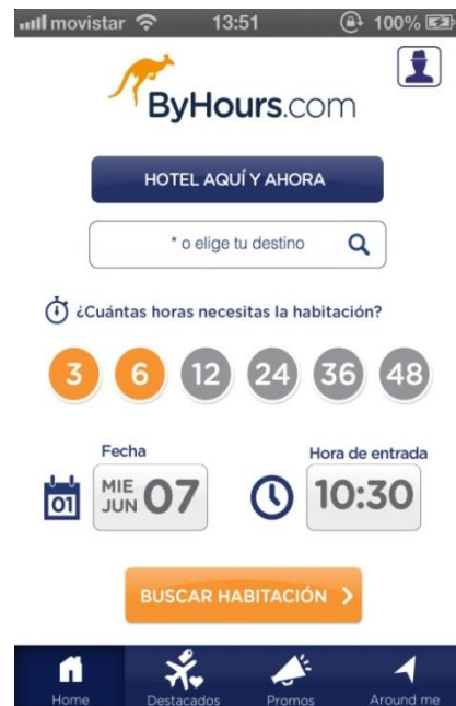
Screenshot de la aplicación ByHours.com para Iphone

La aplicación, referente en innovación dentro del sector del travel online y las reservas hoteleras, gracias al sistema de geolocalización , la permite localizar los hoteles más cercanos al punto donde el usuario se encuentre, y reservar en 3 sencillos pasos: decidiendo ciudad, pack de horas y la hora de entrada al hotel que éste prefiera. Todo para ofrecer reservas flexibles al usuario.