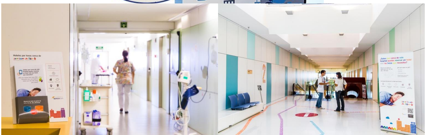
Implantación del servicio en el Hospital Sant Joan de Déu y en Clínica Diagonal